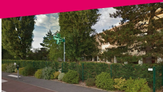
PHARMACIE KASSENTINI 20 AVENUE DE LA 1 ERE ARMEE FRANÇAISE 95160 MONTMORENCY