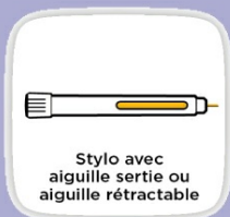
Stylo avec aiguille sertie ou aiguille rétractable