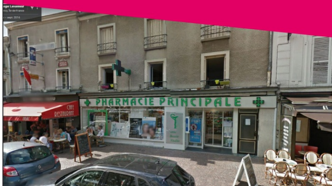
PHARMACIE JOLY 9 PLACE ROGER LEVANNEUR 95160 MONTMORENCY

Où trouver ces boîtes à Montmorency ? Où jeter mes seringues et aiguilles usagées ?