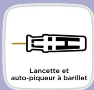
Lancette et auto-piqueur à barillet