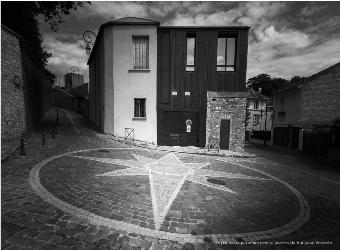
3e prix ex aequo «Entre terre et univers» de Françoise Venante