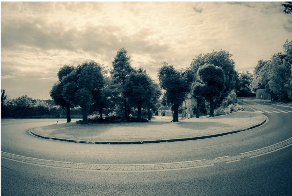
2e prix : Jérémie Benain " Freestyle devant la Collégiale "