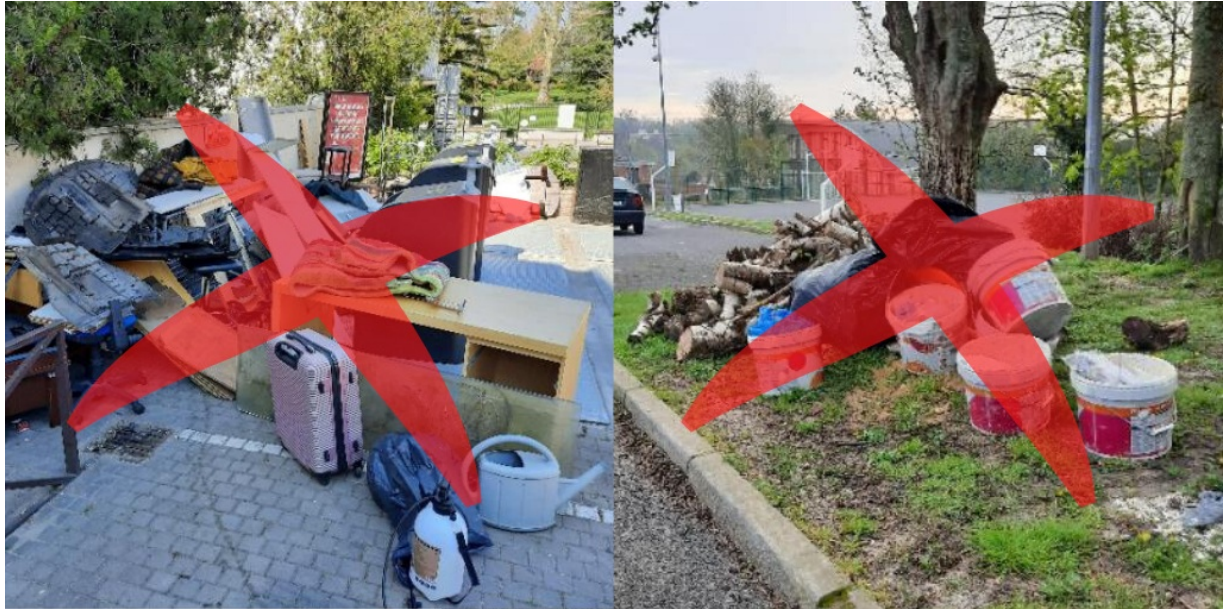
À gauche : Parking Demirleau, 1er avril 2020 | À droite : Parking des Gallérands, 7 avril 2020

Sont interdits : déchets toxiques (pots de peinture...), déchets électriques et électroniques (frigo, machine à laver, pile et batterie...), des déchets végétaux ou d'autres types de déchets (ménagers, verres, gravats et plâtre, fenêtre et vitrage, pneu, bouteille de gaz...).